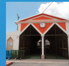
Marché aux vivres