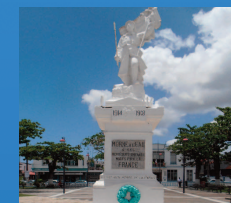
Monument aux morts