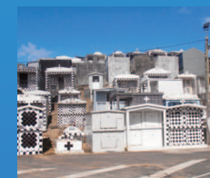
Cimetière : entrée Brion