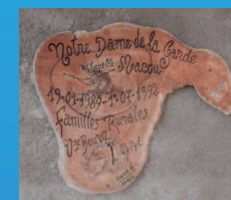
Chapelle de Macou