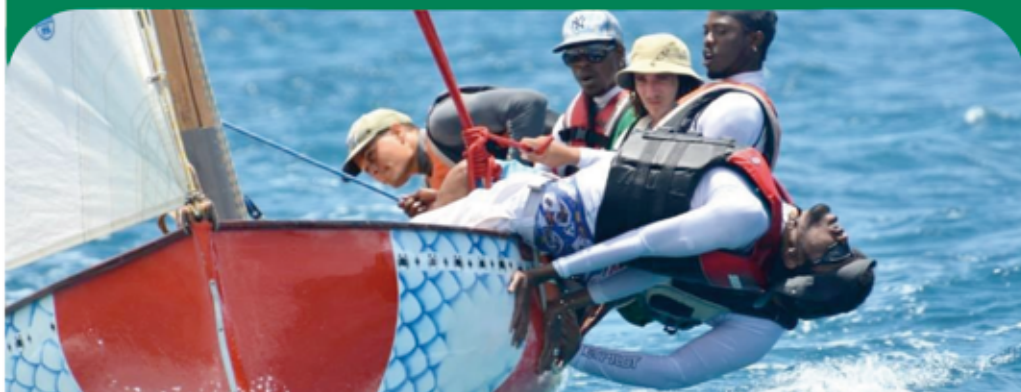
Notre équipage de voile traditionnelle a fini 2 ème de la Régate « Manman Dio ».