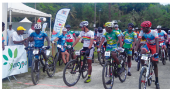
2 ème Edition du Grand Prix de VTT Cross Country.

Ces manifestations de prestige ont été associées évidemment au sport avec la 2 ème édition du Grand Prix de VTT CROSS COUNTRY et la Régate Manman Dio , la marche sur la trace des sources, plusieurs projections de films et des animations culturelles et sportives diverses.