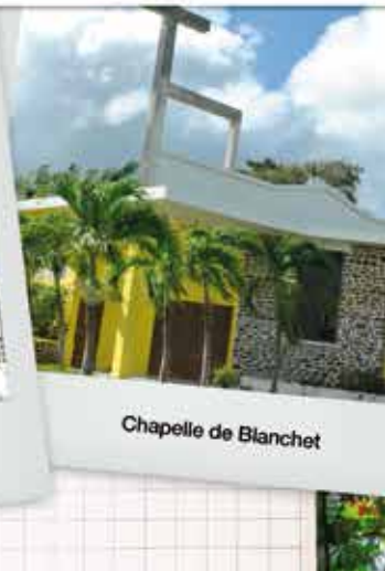
Chapelle de Blanchet