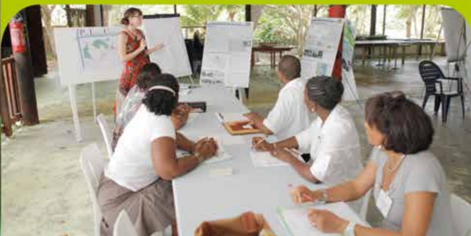
Un des ateliers de travail.

Réunis en séminaire à l'Espace « O BO RAVIN' LA » les élus de Morne-à-l'Eau ont planché sur « L'AMENAGEMENT DU TERRITOIRE ET LE PLAN LOCAL D'URBANISME » de la Ville.