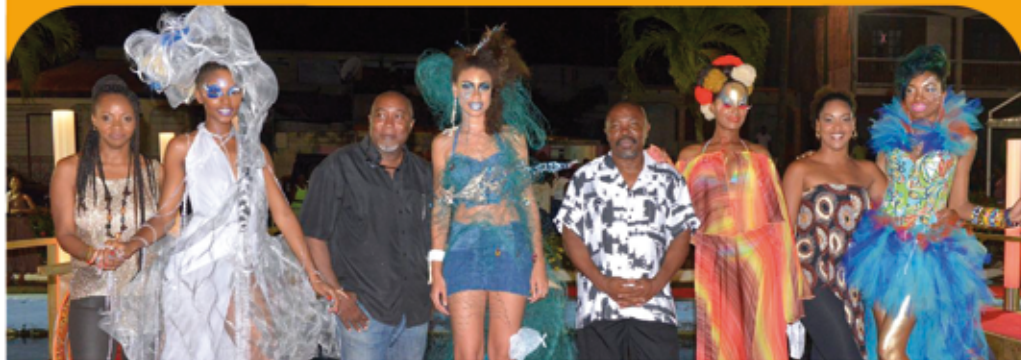
Photo finale avec les designers et leurs modèles sur le thème de la Mer.

Ce show mode, son et lumière et animation musicale en live est venu clôturer le Mois du Nautisme et du Développement Durable sur l'Esplanade du Port de Vieux-Bourg.