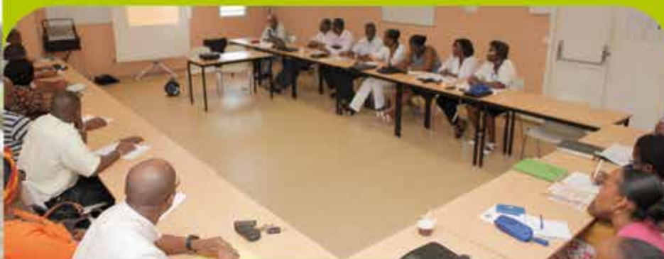
Les élus en séminaire dans les locaux municipaux

Après les élections municipales et communautaires des 23 et 30 Mars derniers et la Cérémonie d'Investiture du Maire et de ses Adjoints, l'heure du travail a sonné pour nos élus.