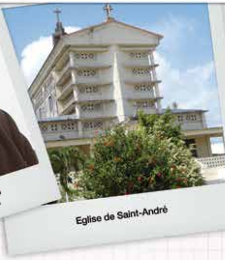
Eglise de Saint-André