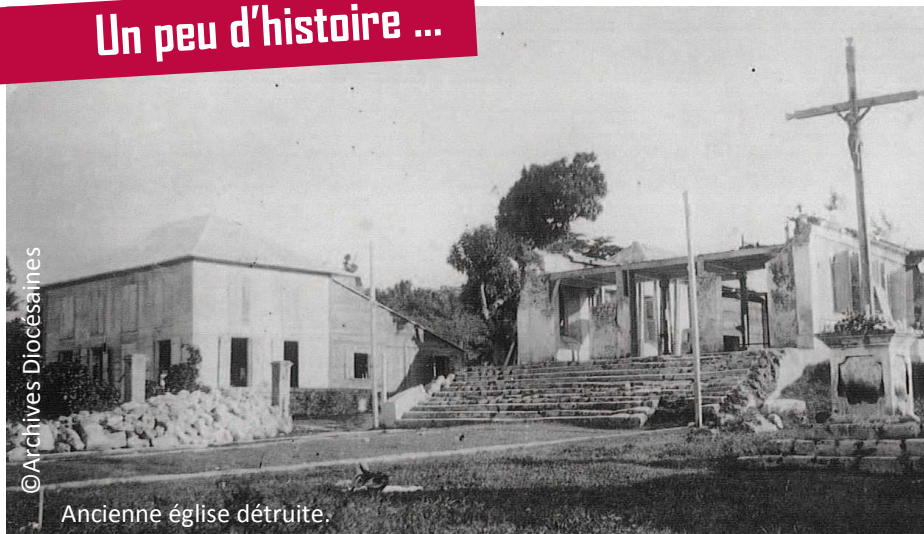
Ancienne église détruite.