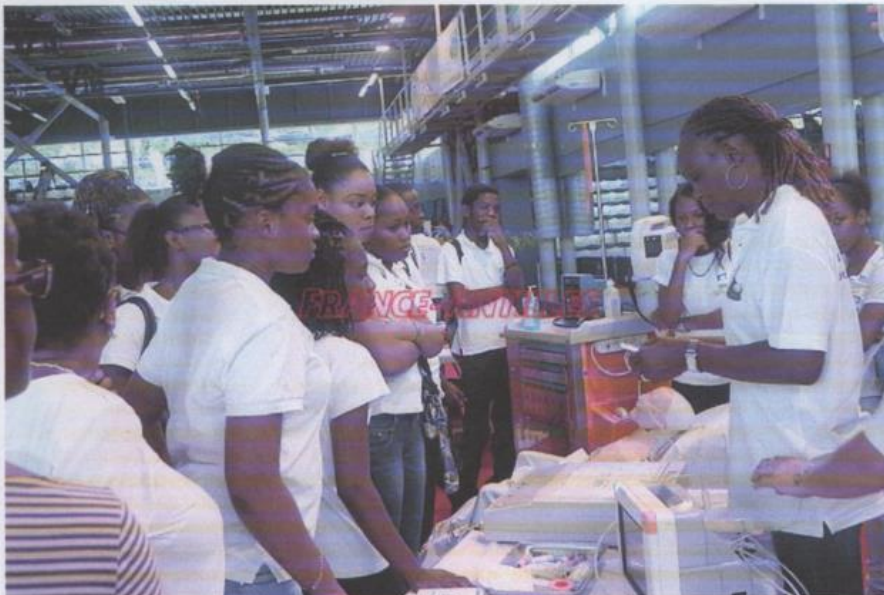
Le stand du service des urgences lors d'une animation proposée aux collégiens.