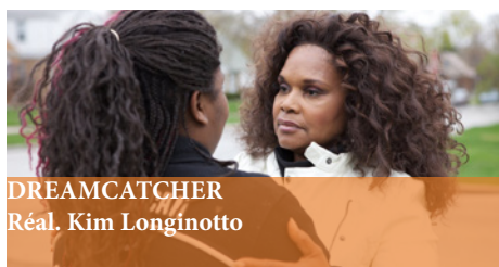
DREAMCATCHER Réal. Kim Longinotto