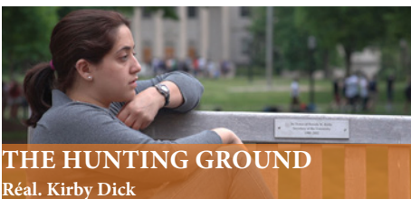
THE HUNTING GROUND Réal. Kirby Dick

En 2009, la Guadeloupe connaît 44 jours de grève générale. Dans les rues, les manifestants entonnent un air relayé par les chaînes d'information du monde entier : La Gwadeloup sé tan nou, La Gwadeloup sé pa ta yo ! (La Guadeloupe est à nous, elle n'est pas à eux). Colère ? Racisme ? Espérance ? L'hymne du mouvement suscite la polémique.