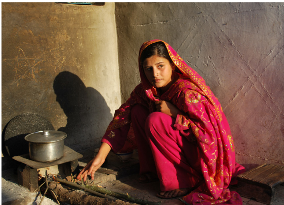
AMONG THE BELIEVERS / Réal. Mohammed Naqvi, Hemal Trivedi