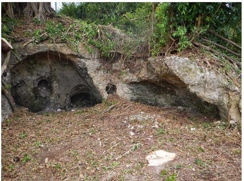
Four à pain de GALLO