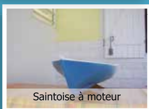
Saintoise à moteur