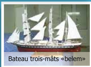
Bateau trois-mâts «belem»