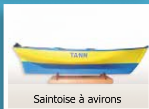
Saintoise à avirons