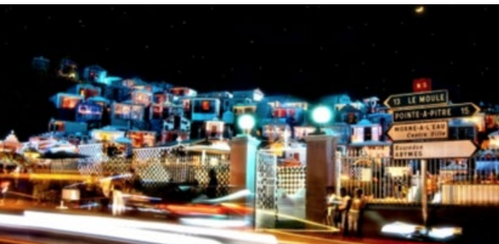
Station 1 : Le Cimetière de Morne à l'Eau, le patrimoine au cœur de la stratégie de la Ville