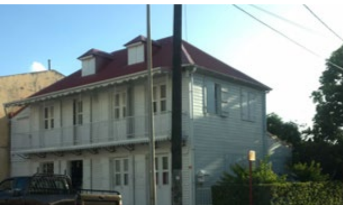
Station 3 : La Maison Chalcou, rue du Débarcadère