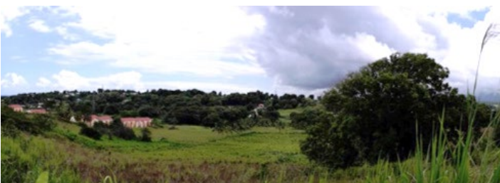
Station 1 : Vue sur Saint Jean, projection d'une nouvelle centralité

3. Démarche de prospective urbaine dans le cadre de la définition d'un schéma de cohérence urbaine et de développement territorial durable (25 minutes)