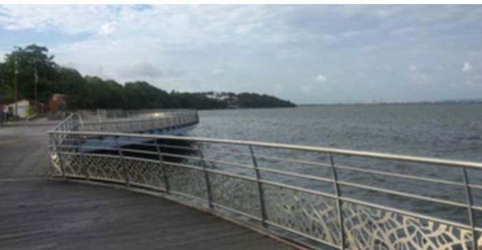
Station 2 : Place SARRAULT, entre pôle d'animation interne et jetée vers l'horizon

Moment de convivialité et de réseautage.