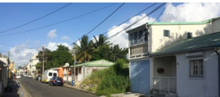
Station 2 : La reconquête des dents creuses, rue Achille René BOISNEUF