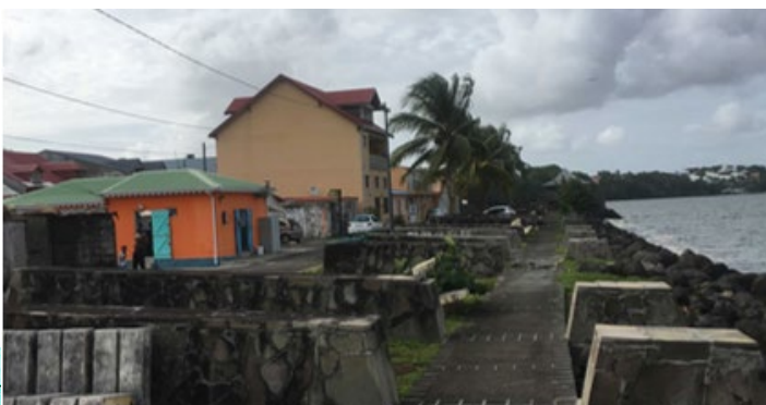
Station 3 : Le littoral petit bourgeois face aux enjeux du réchauffement climatique

• Ateliers thématiques : cas pratiques documents d'urbanisme, plans, schémas, programmation urbaine (revitalisation, rénovation urbaine, RHI/RHS...)