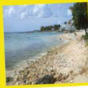
Plage dite d'Antilles