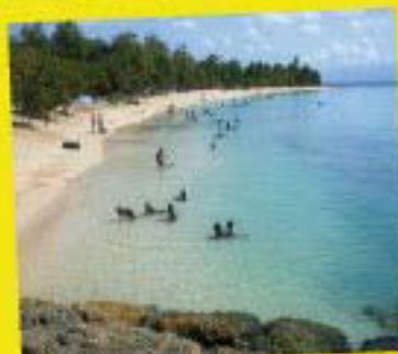
Plage du Souffleur