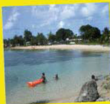
Plage de Zéphyr - Marina