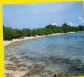
Plage de la Pointe d'Antigue

PRESERVATION et PROPRETE : Affaire de TOUS !