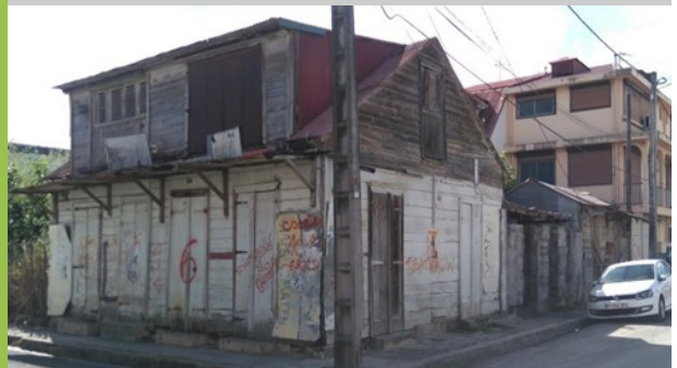
Maison typique de la fin du 19 ième siècle

Des bâtis, Témoignages d'un savoir-faire, d'une expertise; Témoignages de la solidité des bâtis; Témoignages d'une intelligence et d'une élégance architecturale; Témoignages de l'urgence de construire après le cyclone 28, Témoignages de l'impact de courants architecturaux d'une époque : Ali Tur, CORBIN , etc..