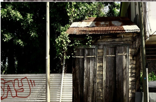
Les « 3 x 6 » délocalisables...hier

Jean-Claude LOMBION Maire de la ville de Morne-à-l'Eau Maire 2005/2016