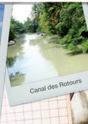
Canal des Rotours