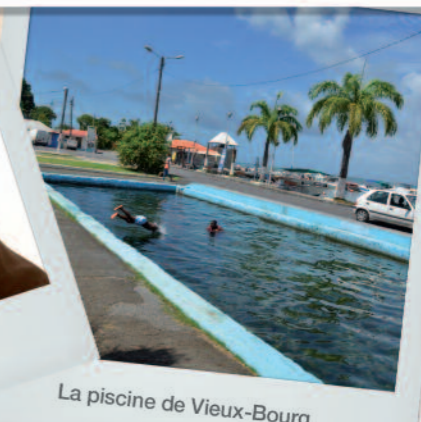
La piscine de Vieux-Bourg