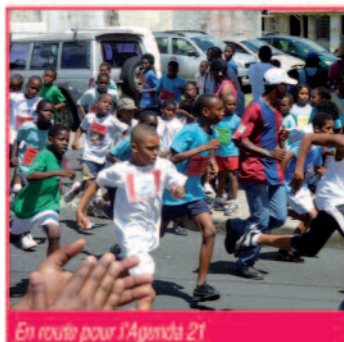
En route pour l'Agenda 21

L'autorisation a été donnée au Maire pour la signature du marché portant sur la réfection des aires de jeux de Vieux-Bourg et de Gensolin. Après consultation des offres, un groupement d'entreprises a été retenu pour une proposition d'un montant de 224 296€.