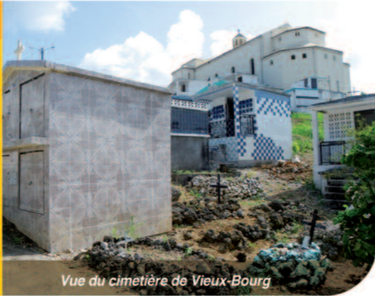
Vue du cimetière de Vieux-Bourg

N'hésitez pas à le demander, ou à poser vos questions au Service de l'Etat Civil 0590 24 27 13 ou au Conservateur des Cimetières au 0690 15 01 91.