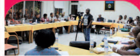
Une réunion plénière du Conseil Municipal

Dans un contexte économique, de plus en plus rigoureux, qui pénalise le pouvoir d'achat des ménages, la Municipalité a souhaité participer à l'amélioration du quotidien et des conditions de vie de ses agents.