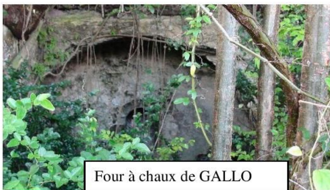
Four à chaux de GALLO