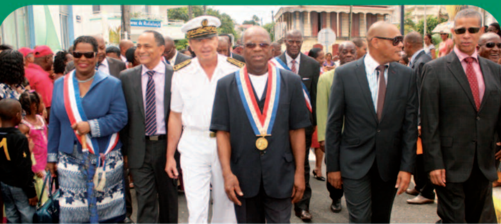
Le défilé des Officiels

Le cortège populaire des personnalités, des associations, des familles, de la fanfare, des majorettes et des citoyens mornaliens dans les rues de la Ville et la cérémonie protocolaire sur la place Gerty Archimède ont constitué un des temps forts de la Fête Patronale du dimanche 1 er décembre 2013 .