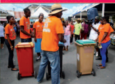
L'animation autour des déchets proposée par les médiateurs du développement durable

Cette première brocante solidaire et durable sur le territoire communal organisée par la Ville de Morne-à-l'Eau sur le parking du stade municipal Pierre Monnerville a connu un grand succès populaire par le nombre de participants et la visite tout au long de la journée du public ravi de découvrir cette animation culturelle et commerciale qui sortait de l'ordinaire.