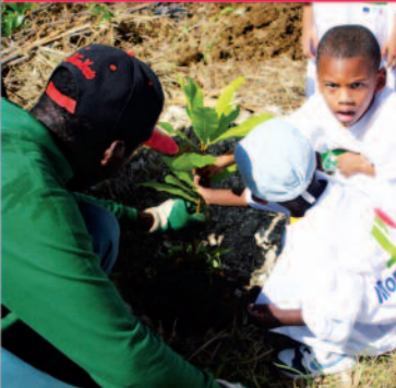
Un agent technique de la Collectivité aidant des jeunes à planter un arbre

90 élèves de l'école maternelle de Pointe-à-Retz, 16 enseignants et 10 emplois civiques embauchés par la Ville ont procédé à la plantation de 110 arbres le long du parcours urbain du Canal des Rotours, en privilégiant une action symbolique dans le cadre de la Fête Patronale 2013.