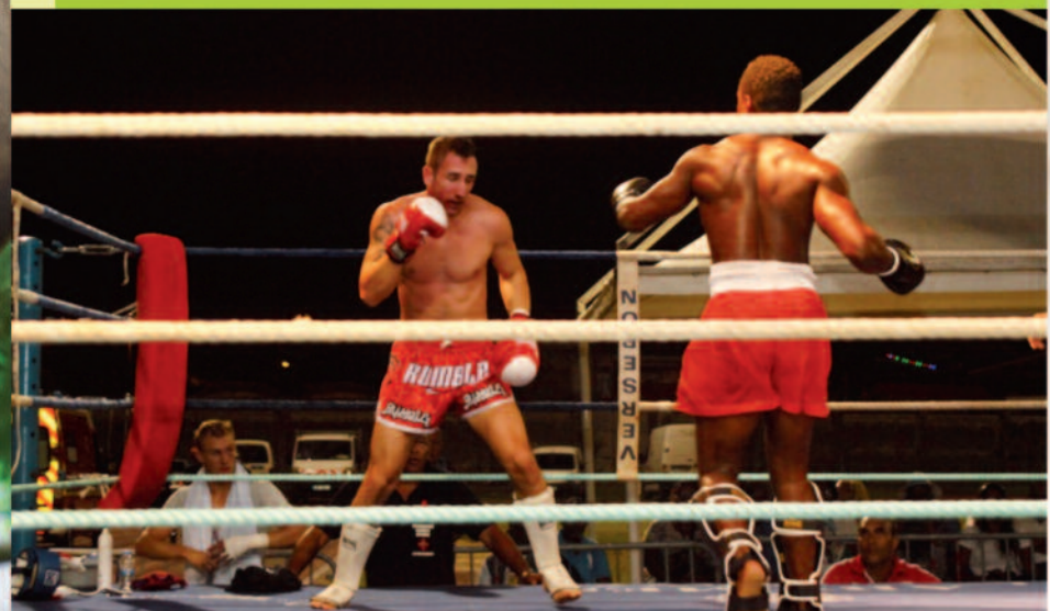
Au cours de l'un des combats de boxe

Ce gala de boxe sous l'égide du « Ring de Morne-à-l'Eau » avec le soutien de la Ville a été organisé au stade municipal Pierre Monnerville. Cette discipline sportive se relève progressivement pour le plus grand plaisir de ceux qui l'apprécient à Morne-à-l'Eau et plus largement en Guadeloupe. L'un des fondamentaux de ce sport : l'endurance pour bien pratiquer ce «noble art» où tous les coups ne sont pas permis !