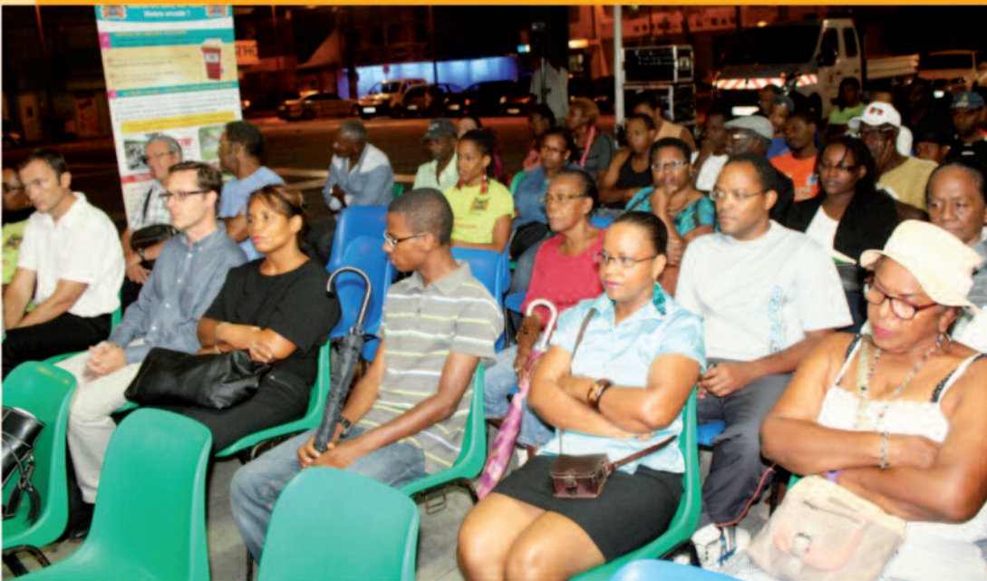
Un public attentif

Dans le cadre de la Fête Patronale, la Ville de Morne-à-l'Eau et le Syndicat de Valorisation des Déchets de la Guadeloupe (SYVADE) avaient invité le public à une réunion d'information sur la Plateforme Multifilières du SYVADE et le Pôle de Valorisation des Déchets de Morne-à-l'Eau.