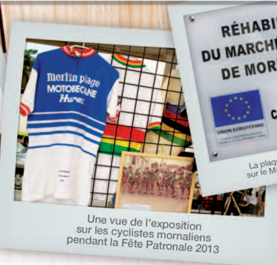
Une vue de l'exposition sur les cyclistes mornaliens pendant la Fête Patronale 2013