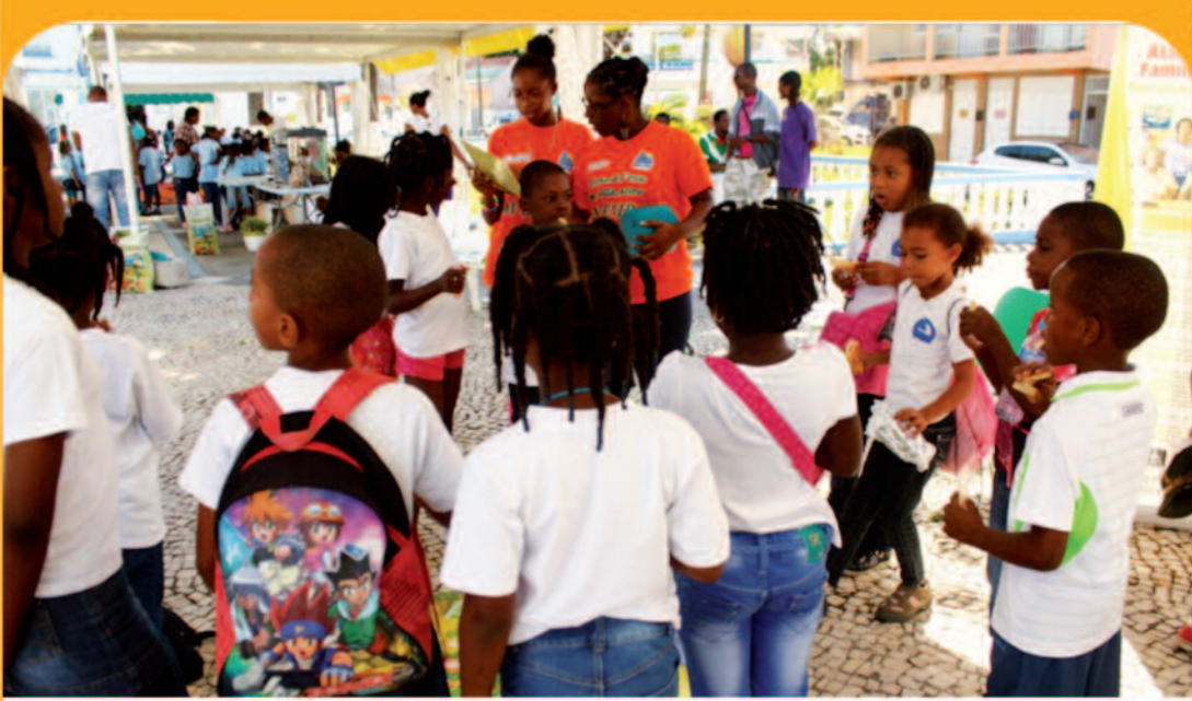
Des élèves visitant l'un des stands du forum

Ce forum, organisé dans la dernière semaine du mois de novembre 2013 sur la place Gerty Archimède, a réuni un grand nombre d'organismes s'occupant de la socialisation des jeunes et de la professionnalisation de la jeunesse.