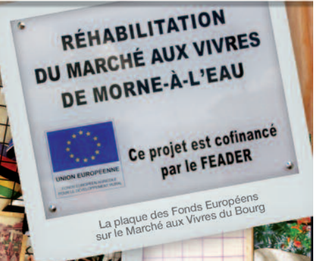
La plaque des Fonds Européens sur le Marché aux Vivres du Bourg