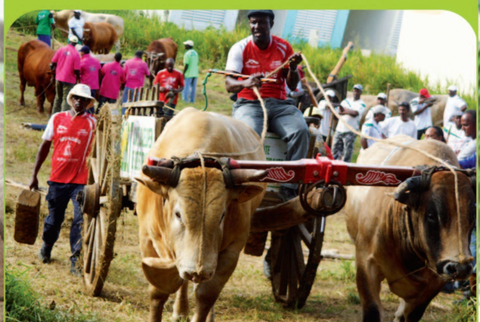
Le Grand Prix de la Ville de Morne-à-l'Eau

La foule des grands jours avait fait le déplacement pour la compétition de bœufs-tirants des catégories A, B, C pour le Grand Prix de la Ville de Morne-à-l'Eau organisé dans le cadre de la Fête Patronale avec le concours de l'association Les Solides . Pendant toute une journée, les différents attelages concurrents se sont affrontés dans une ambiance de fête et devant un public connaisseur de belles bêtes créoles et de cette discipline devenue traditionnelle et populaire.