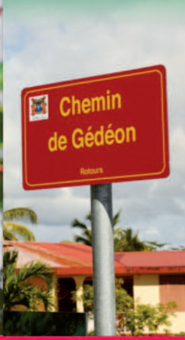
Un des panneaux posés à Gédéon

A l'occasion de la Fête Patronale 2013, la municipalité, dans le cadre de sa politique d'adressage, a procédé à la pose de quatre panneaux dont celui du chemin de Gédéon à Rousseau , en présence du Maire, d'élus municipaux, de techniciens de la ville et de riverains.