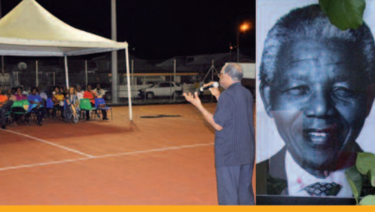
Le Maire s'adressant au public

La Ville, la population, les forces vives, les associations, les élèves, les collégiens, les lycéens, les étudiants, les enseignants et des personnalités guadeloupéennes ont rendu un vibrant hommage à Nelson MANDELA le dimanche 15 décembre 2013 sur le terrain de hand-ball du boulevard Mandela à Morne-à-l'Eau. Cette soirée agrémentée de musique, de témoignages, de prestations artistiques et culturelles a permis le jour-même de ses funérailles, de célébrer la mémoire de cet homme exceptionnel, combattant historique exemplaire de la lutte contre l'Apartheid et la domination de l'homme par l'homme. Les Mornaliens et tous leurs invités venus de toute la Guadeloupe ont exprimé toute leur gratitude à cet extraordinaire défenseur de la liberté, de la démocratie, du progrès social et des Droits de l'Homme.