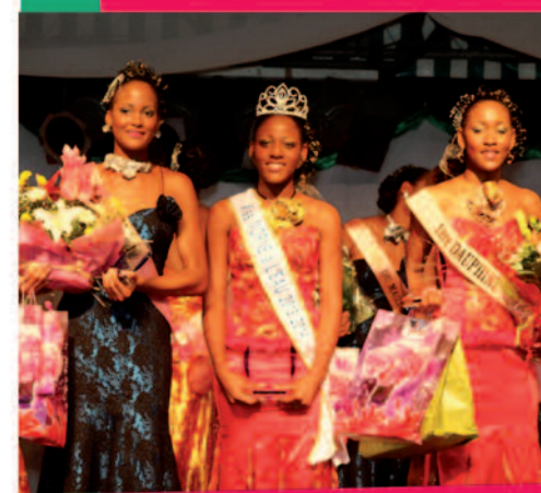
La Nouvelle Miss Morne-à-l'Eau 2013-2014 et ses dauphines