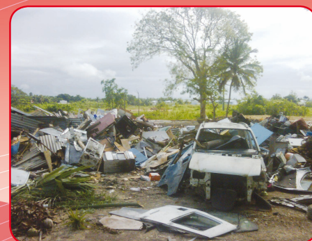
Malpwoptaj non !