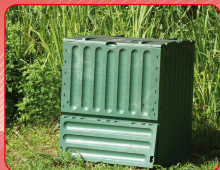
Konpostaj oui !