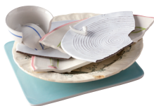
Vaisselle, faïence, porcelaine