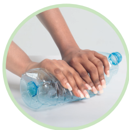
Écrasez votre bouteille (débouchée) à plat.

Oui : vous réduirez ainsi leur volume et faciliterez leur collecte et leur recyclage. Mais, attention : écrasez-les à plat (sur une table, par exemple) et rebouchez-les pour qu'elles ne se regonflent pas.