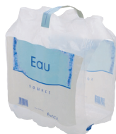
Suremballages, sacs et films en plastique