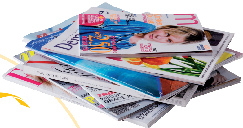
Magazines et catalogues