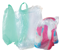
Sacs en plastique

Non recyclé > À jeter dans votre poubelle habituelle