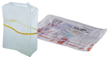
Film en plastique de suremballage de journal

Non recyclé > À jeter dans votre poubelle habituelle