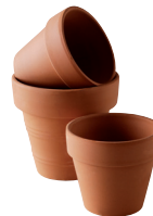
Pots de fleurs