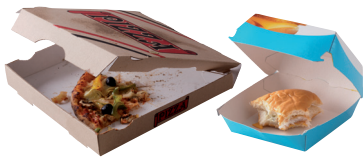
Emballages sales non vidés

Non recyclé > À jeter dans votre poubelle habituelle