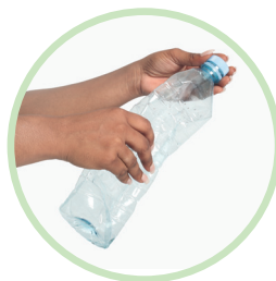
Rebouchez-la. Vous pouvez la déposer dans un conteneur bleu.