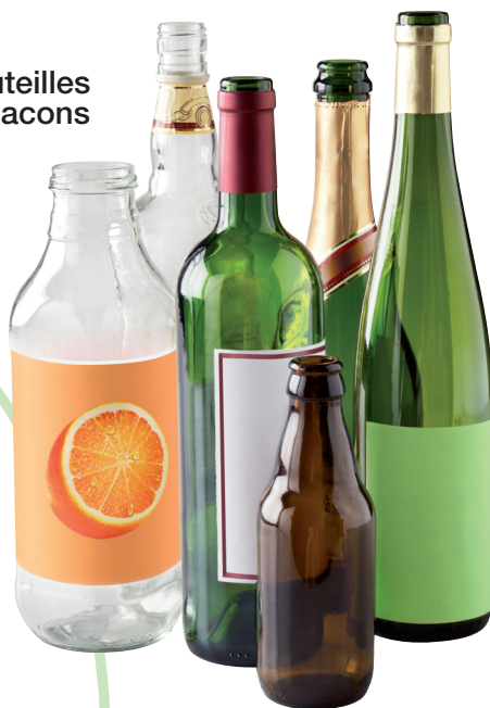
Bouteilles et flacons