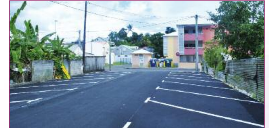
Nouveau parking du cimetière du Bourg

Ainsi, cet expert a déjà entrepris la réalisation de plans spécifiques, un état des lieux précis des cimetières selon différents axes (géographiques, administratifs et juridiques) a été réalisé, puis complété en allant à la rencontre de la population pendant la Toussaint . La base documentaire a été réorganisée pour une meilleure gestion générale, à l'aide notamment d'un logiciel de gestion spécialisé. Une cartographie et une signalétique complètes ont été installées dans les deux cimetières (avec une numérotation individuelle des concessions) pour faciliter l'orientation et l'identification des sépultures. Des bornes d'orientation interactives fonctionnant à l'énergie solaire sont même prévues à terme pour orienter, mais aussi informer sur le patrimoine funéraire spécifique de la Ville qui est une parcelle importante de notre histoire et de notre culture qu'il convient de sauvegarder, de répertorier et de mettre en valeur pour le pérenniser.