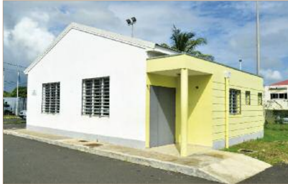
La Maison de Quartier de Lasserre

LA VILLE EN MAITRISE DIRECTE a pris en charge le Chemin de Chamfleury pour 471.567,21 euros et les routes de Boivin, de Réduit, de Naud, de Babin et de l'entrée de l'École de Pointe-à-Retz pour un coût de 546.148,47 euros .