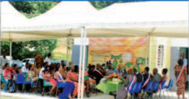
Vin d'honneur de la fête de Sauvia, Dubelloy, Saint-Sauveur, Trois-Chemins de Vieux-Bourg et Geffrier à la Maison de Quartier de Sauvia-Dubelloy.

L'Association Sportive et Culturelle de Sauvia (A.S.C.S.M), l'association Pavé La, l'association Ensemble Main dans la Main, rassemblées ont fêté les quartiers de Sauvia, Dubelloy, Saint-Sauveur, Trois-Chemins de Vieux-Bourg et Geffrier. Au cœur de la Fête 2013, la valorisation du Fruit-à-Pain local.