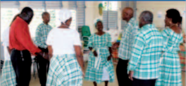
L'Association Culturelle et Sportive l'Indomptable de Bosredon

Le Collectif des Associations de Bosredon profitant de la période des grandes vacances scolaires de Juillet a mis au point et réalisé un programme de réjouissances à la hauteur du nombreux public attendu. Le Léwoz, toujours le Léwoz a attiré la grande foule.