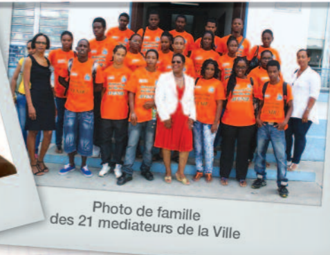
Photo de famille des 21 médiateurs de la Ville