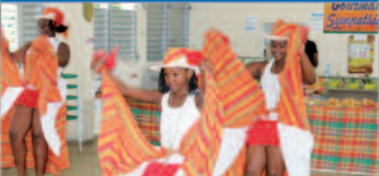
L'Association ALPHA de Lasserre Morne-à-l'eau

Le Collectif des Associations de Lasserre a pris les choses en main pour fêter comme à son habitude la section autour d'un programme de festivités qui a réuni toutes les générations. L'intergénérationnel était de la partie.