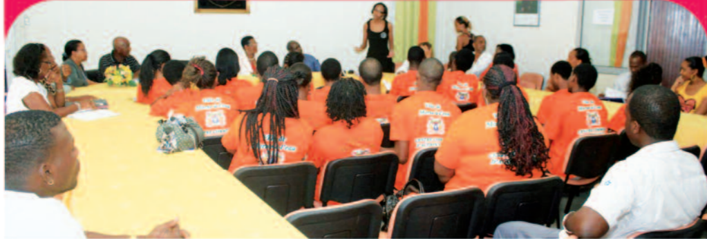
Rencontre à la Mairie avec les 21 volontaires du service civique

Le service civique est un service géré par l'Etat ouvert aux Jeunes de 16 à 25 ans et constitue une opportunité permettant aux jeunes retenus d'avoir une première expérience dans le monde du travail. Le volontaire est quelqu'un qui veut se rendre utile à la société et qui donne de son temps pour une activité d'intérêt général.