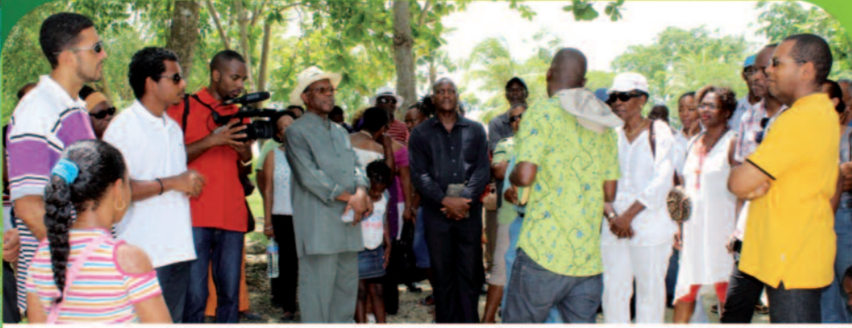
Visite guidée de la Plage de Babin