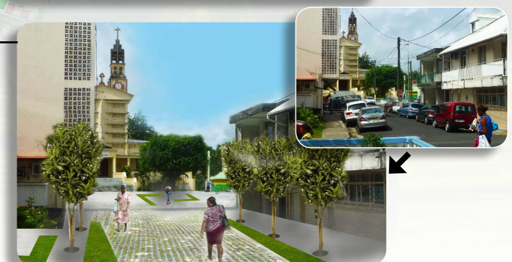
Rue et place de l'église