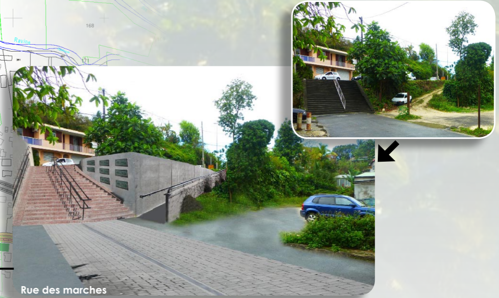
Rue des marches