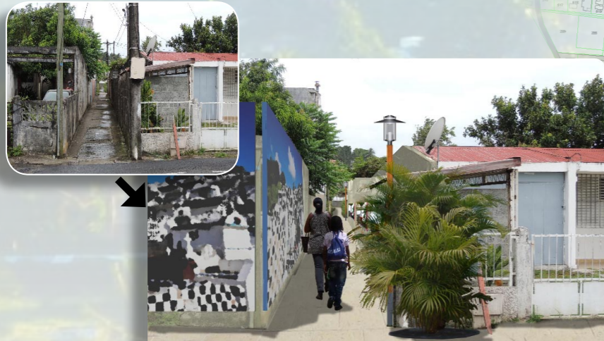
Venelle depuis la rue Léon Blum