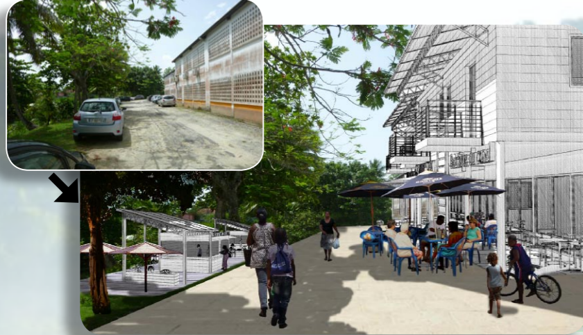
Chemin de Bordeaux Bourg, le long du Canal des Rotours