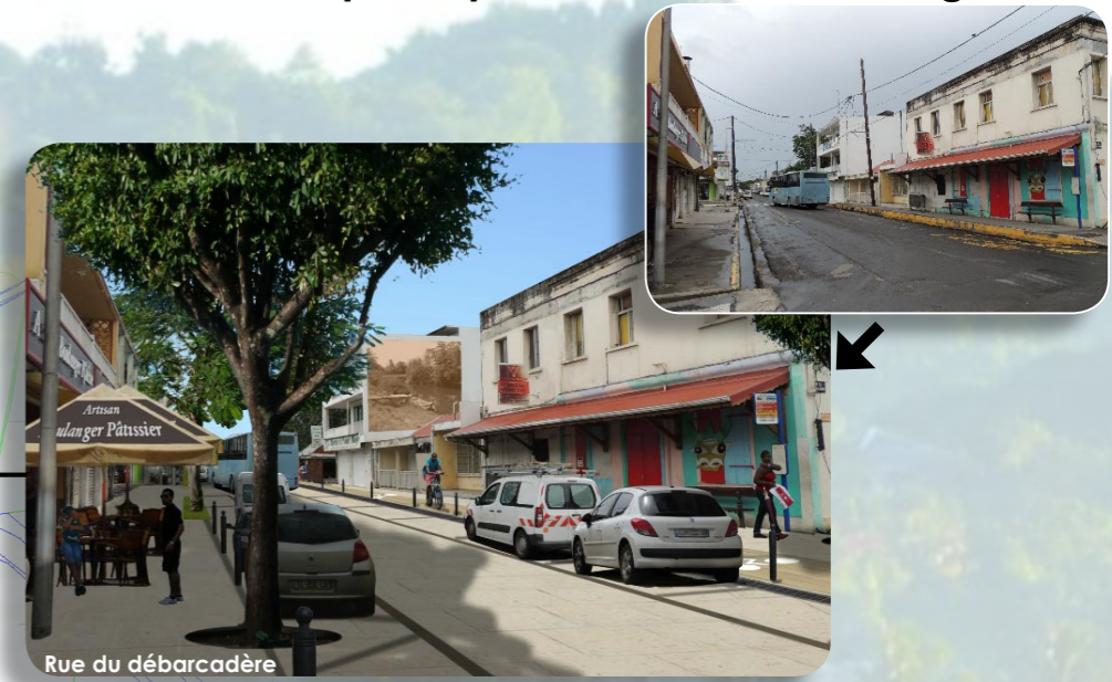
Rue du débarcadère